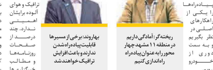
بهاروند: برخی از مسیرها قابلیت پیاده‌راه شدن ندارند و باعث افزایش ترافیک خواهند شد

به گفته شهردار منطقه ۱۱ شهرداری مشهد، به‌کارگیری سیستم‌هایی مانند الیت و محدودکردن پارکینگ‌ها یا اضافه کردن پارکینگ‌ها در کلان‌شهرها پاسخ‌گو نیست و باید ایجاد و استفاده از پیاده‌راه‌ها را یکی از راهکارهای اصلی در نظر بگیریم و به سمت دوری از خودرو برویم.