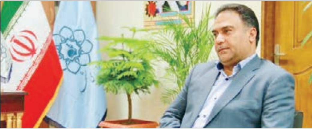
شهردار منطقه ۱۲: